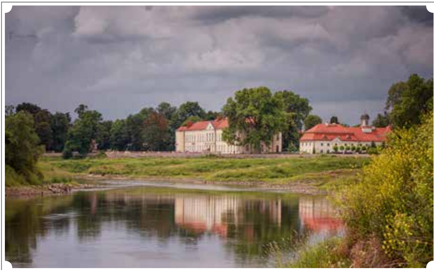
fol. Maciej Trubisz